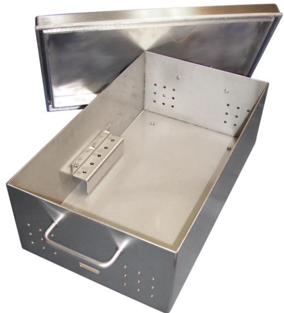
Abb. 2: Schirmbox mit den Abmessungen 300 x 520 x 170 mm, ohne Ausstattung

Rohrdurchführungen für LWL, HF-Durchführungen , Schirmfenster , EMV-Filter , Mikrowellen-Absorber , kleine Antennen .